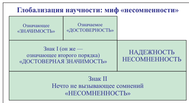
Рис. 2 | Схема образования мифа понятия «несомненности»

Подобным же образом может быть описана замена термина «значимость» на «достоверность».